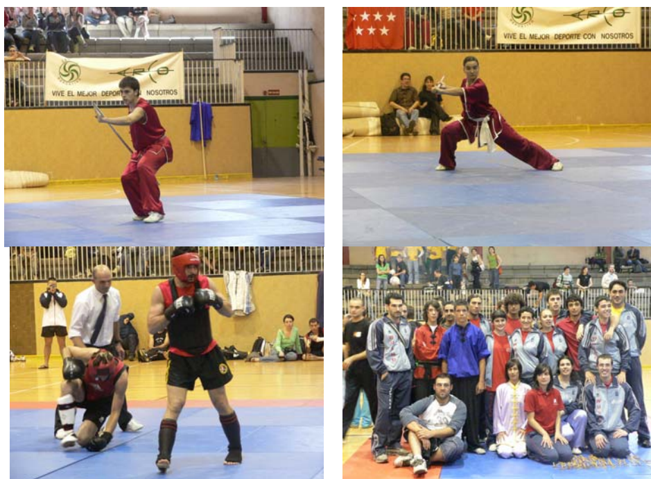
Selección Galega no Campionato de España 2007