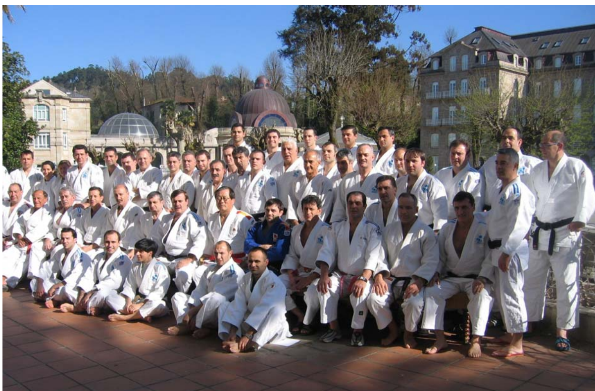
ASISTENTES AO VIII CONGRESO DE MESTRES DE JUDO DE GALICIA

Dentro do programa de actualización de membros de tribunais de exame esta Escola Federativa organizou en Xuño un curso de reciclaxe en Pontevedra baixo a dirección e supervisión do mestre e membro da comisión nacional de katas: